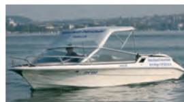
Im Winter geheizte Boote

Ganzjahresbetrieb Zürich- und Obersee Theoriekurs jeden Dienstag Kategorie A+D